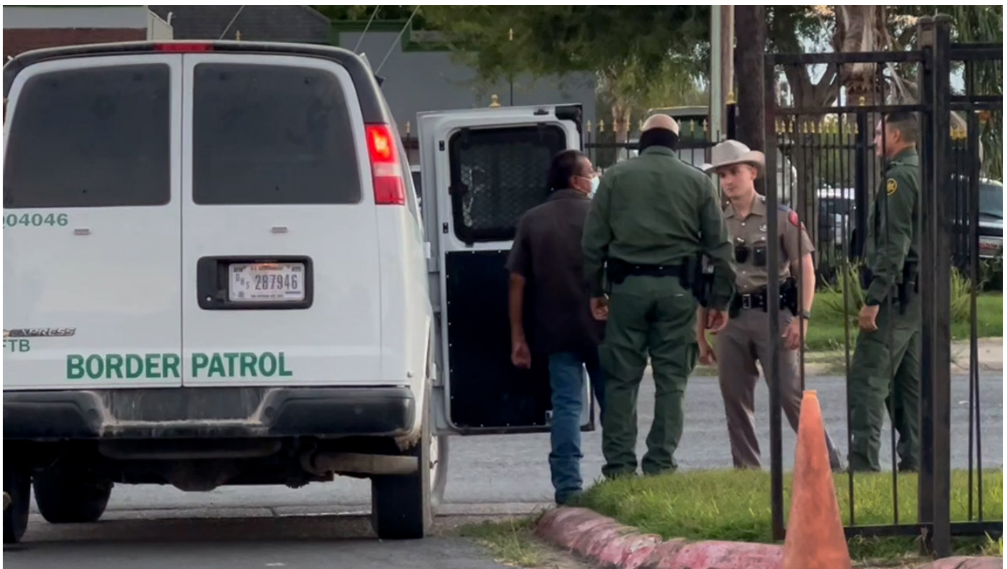
Agentes de CBP detienen a una persona en el Valle del Rio Grande